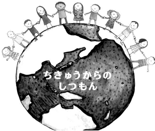
え：うしじま ひろみ ぶん：マツダ ミヒロ

子育てをしているとき、 仕事と家事を両立させようとがんばっているとき、 イライラしてしまうことがあります。