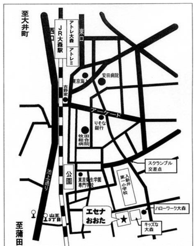
JR京浜東北線 大森駅より徒歩8分 駐車場はありません。